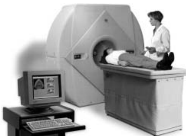
Рис. 4. Специализированный дентальный компьютерный томограф НьюТом.

НьюТом (Рис. 4) позволяет в течение 70 секунд получить трехмерное рентгеновское изображение челюсти (Рис 5), либо всей головы пациента. При этом доза, получаемая пациентом в 5 раз меньше, чем при исследовании на обычном компьютерном томографе. Для позиционирования пациента применяется система лазерного наведения.