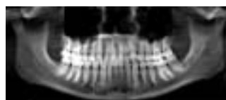
Рис. 5. Панорамный срез трехмерной модели.