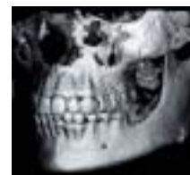
Рис. 6. Трехмерное рентгеновское изображение челюсти.

Трехмерное изображение хранится в памяти компьютера и позволяет рентгенологу получить любое сечение зоны интереса и любую проекцию. Одна трехмерная модель позволяет отказаться от дентальных и панорамных снимков любой сложности (Рис 6).