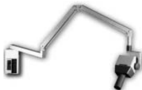
Рис. 1. Дентальный снимочный аппарат ЭКСПЛОР

позиционирования применяется при изучении коронки зуба и верхней трети корня. Позиционирование пальцем позволяет получить снимок всего зуба. Прикусывание позволяет изучить жевательную поверхность зуба.