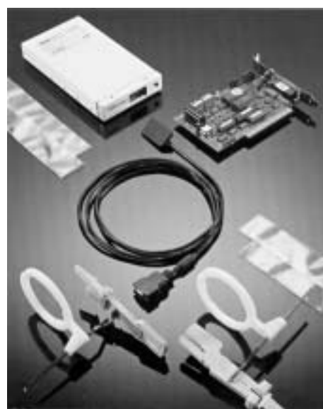
Рис. 3. Комплектация радиовизиографа

Вторым распространенным методом получения цифрового дентального рентгеновского снимка, который внедрила финская фирма СОРЕДЕКС (аппарат ДИГОРА), является использование фотостимулированного люминофора, который после экспозиции считывается сканером.