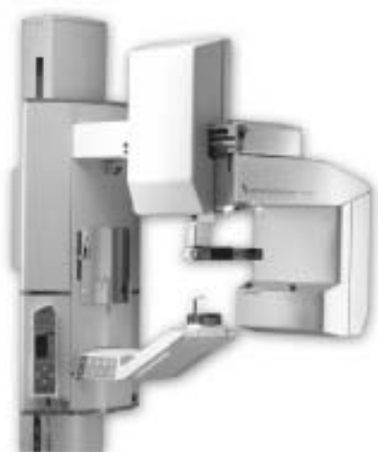
Рис. 2. Ортопантомограф OP 100

Принцип действия ортопантомографов (Рис. 2) состоит в том, что излучатель и кассета с пленкой согласованно двигаются вокруг головы пациента. При этом форма фокального пути соответствует усредненной форме челюсти (Рис. 3). Разные фирмы используют как разные математические модели формы челюсти, так и разные способы позиционирования пациента. Чаще всего пациенту предлагается прикусить специальный фиксатор, иногда позиционирование выполняется по трем точкам - лоб и ушные раковины, лоб подбородок и виски и т.п.